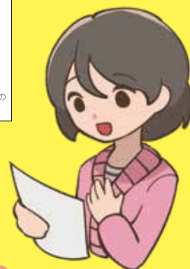
イラスト: 小澤 遥 (駒込高校・美術部)

早期発見のカギは、定期的ながん検診を受けること。貴重な機会を、どうか逃さないください。