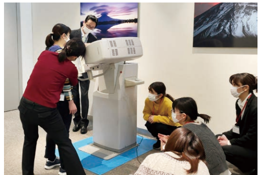
撮影時のポジショニングの実習