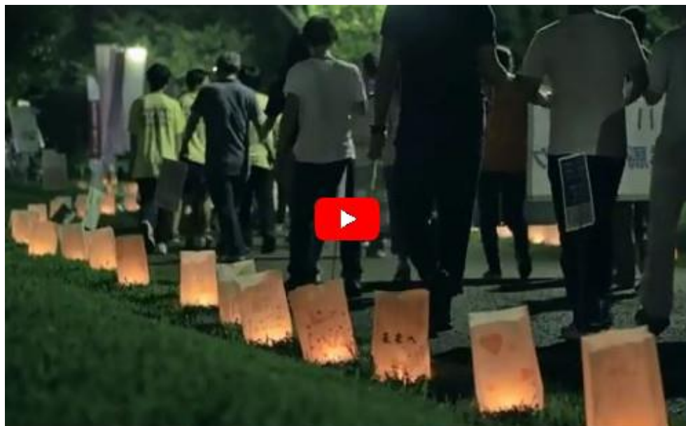
日本対がん協会プロモーション・ムービー