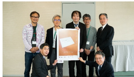
審査会で最優秀賞作品を囲む審査員

高校生以上の学生を対象に公募した「第6回がん征圧ポスターデザインコンテスト」の入賞作品（最優秀賞1点、優秀賞3点、入選8点）が決定しました。このコンテストは、若い世代に「がん」や「がん検診」について知ってもらい、新鮮な発想でがん検診の受診を呼びかけるポスターを作成することを目的に開催しました。