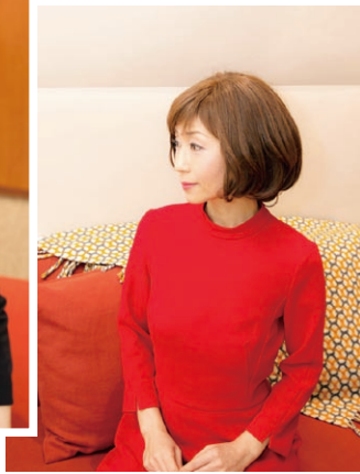
ポーズもばっちり

10月28日、東京・中央区の資生堂ライフクオリティービューティーセンターで、乳がん、子宮頸がんなどの女性のがん患者さんを対象にしたキレイ体験「ビューティー スマイル プロジェクト～キレイの力で元気になろう～」を開催した。色素沈着や脱毛など治療で生じる美容の悩みをお持ちの方を、プロの手で変身させようというプロジェクトが企画したこの体験会は、昨年