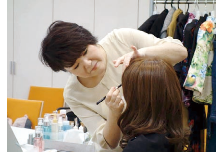
あざやかな手つきでプロがメイク

今回の参加者の方々のうち3人が家族同伴で参加したが、横で徐々に変身していく姿を見ながら、ご家族のみなさんも嬉しそうだった。時間が経つにつれ、参加者同士も打ち解けて友達