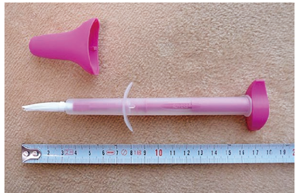
モデル事業で用いる検体採取用の「エバリンブラシ」

西日本のある県のデータによりますと、子宮頸がん検診の受診者におけるがん発見率(上皮内がんを含む)を「初回」(約25000人)と「非初回」(約65000人)と比較すると、初回は0.11%で、非初回が0.03%でした。受診しなかったり、受診間隔があいていたりして