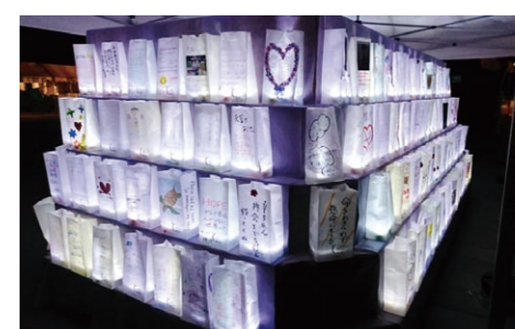
グアムのRFL会場を参考に、10月のRFLJ2017東京上野の会場でも積み上げられたルミナリエ。

サバイバーズラップ、ルミナリエ…。私たちは、本質を突き詰めて来たか、経年により、形骸化、イベント化、ルーティン化していないだろうか。私達は(私は、というべきか)一介のボランティアです。出来る事と出来ない事があり、時に憤る事も多くあります。上部組織との意思疎通の問題など、なかなか難しい事も多くありますが、日本対がん協会と共に、立場が違っても大目的の「がん征圧」を目指し、何が本質で、自分はどういう立場で何をすべきか。そうした事をそれぞれがもう一度心から見つめ直し、微力かも知れないけれど与えられた使命を全うする、と言う事を心に刻んだ旅でした。