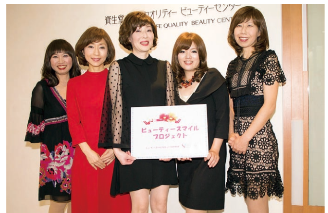
華やかさに笑顔が加わって