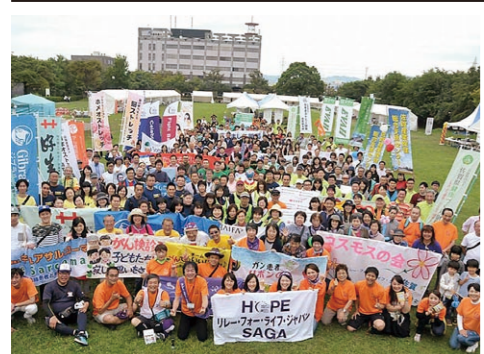
みんな笑顔の参加者

まずはこの場を借りて、3回目の開催となるRFLJ2017佐賀リレーイベントを無事終了しましたことをご報告させていただくとともに、参加していただいた方へ協力していただいたすべての皆様に感謝と御礼を申し上げます。