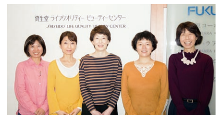
「キレイ体験」前の参加者のみなさん