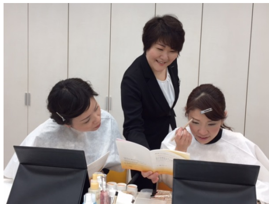
* 写真はモデルです