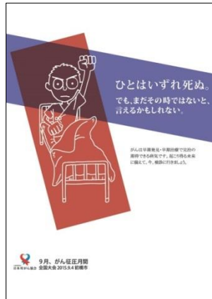
第3回(2015年度) 最優秀賞 東海大学 関 花恵さんの作品