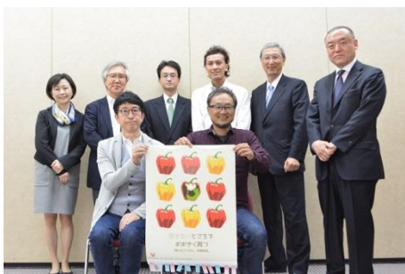
2016年4月13日に行われた審査会の様子

しかし、全体のトーンが平和すぎて病院に掲出される多くのポスターの中で目立ちにくいのではないかという意見があった。